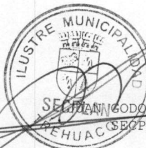
SEBASTIÁN GODOY BUSTOS SECPLAN