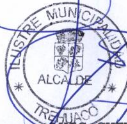
LUIS CUEVAS IBARRA ALCALDE

Transparencia (1) Fiscalía (1) Secretaría Municipal (3) Fiscal (1)