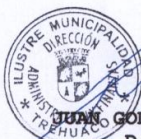
JUAN GODOY BUSTOS D.A.F

El Monto total adjudicado es de $ 2.168.061 (dos millones ciento sesenta y ocho mil sesenta y un pesos) gastos e impuestos incluidos, en un plazo de entrega de 20 días corridos.