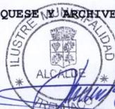
PAUL ESPEJO ESCOBAR ALCALDE