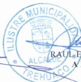
RAUL ESPEJO ESCOBAR ALCALDE