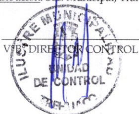
V.B. DIRECTOR CONTROL

Distribución: Sec. Municipal, Transparencia, Archivo CCSP, Archivos