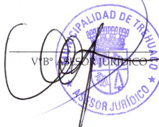
V.B. ASesor JURÍDICO