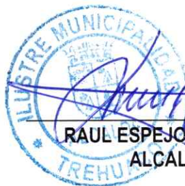
RAUL ESPEJO ESCOBAR ALCALDE